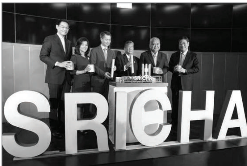
พิธีเปิดการซื้อขายหลักทรัพย์วันแรกของ บริษัท SCC กรกฎาคม พ.ศ. 2555