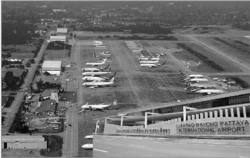
สนามบินอุตะเถา อ.สัตหีบ จ.ชลบุรี

ช่วงปี 2516 ขณะนั้นสงครามเวียดนามกำลังจะเลิก ทหารอเมริกันที่เข้ามาตั้งฐานทัพในประเทศไทยกำลังจะย้ายกลับประเทศจึงทำให้มีข้าวของเครื่องใช้ของทหารอเมริกันหลงเหลืออยู่เป็นจำนวนมาก ร้านค้าของชาวบ้านแถวสัตหีบ บ้านฉาง ซึ่งเป็นที่ตั้งของฐานทัพอุตะเถา จึงเอาข้าวของเครื่องใช้เหล่านี้มาวางขายกันดาษดื่น