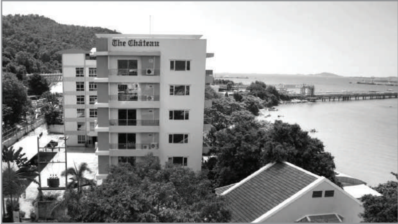
โรงแรม ชาโตว์ วิสตา ชายฝั่งทะเลศรีราชา

ในครอบครัว ทำแบบพอประมาณ โดยไม่ต้องไปกู้เงินใครมาสร้าง ถ้า คุณกู้เงินมาสร้าง คุณก็เจ๊ง โอกาสที่จะรวยยาก แต่ก็มีเหมือนกันที่เขา กู้เงินมาสร้าง แล้วเขารวย นั่นหมายความว่า คุณต้องดูแลดี ต้องดูแล ตลอดถ้าจะทำแบบปล่อยให้ใครก็ไม่รู้มาดูแล ก็ไม่ได้ผลเท่าที่ควรหรอก อย่างอพาร์ทเมนต์ที่คนรู้จักกันเปิดอยู่ ป्लุกบนเนื้อที่ 2 ไร่ เขาก็ปลุกบ้าน ของเขาอยู่ก่อนแล้ว จึงมาสร้างอพาร์ทเมนต์หลัง แล้วให้คนในครอบครัว มาช่วยดูแล นั่งเก็บเงิน เงินทองไม่รั่วไหล อพาร์ทเมนต์ของเขาก็ไปได้” บุญเครือให้ข้อคิด