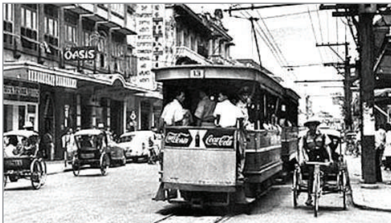
รถรางไฟฟ้าย่านเจริญกรุง - ถนนตก

“ผมวิ่งขายเรียงเบอร์จากศาลหลักเมืองไปถนนตก ผ่านเยาวราช โรงหนังโอเดียน ช่วงนี้จะขายดีเพราะมีคนเยอะ แล้วไปเจริญกรุง ถนนตก ระยะทางประมาณ 8-9 กิโลเมตร ต้องวิ่งแข่งกัน ใครเร็วกว่าก็ขายได้ก่อน ทั้งเหนื่อย ทั้งเมื่อยแต่ก็ต้องทน เพราะเราอยากได้สตางค์” บุญเครือเล่า ชีวิตในวัยเด็กที่ไม่ได้คาบซ้อนเงินซ้อนทองออกมา