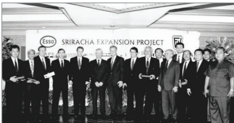
รับงานจากบริษัทข้ามชาติ