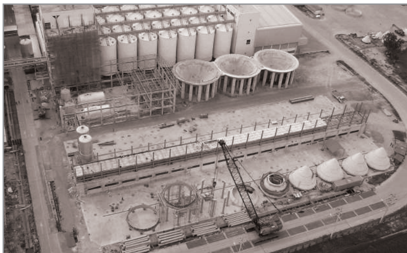
โครงการ เปียร์ซ้าง